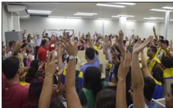
ASSEMBLEIA Uma das mais participativas já realizadas pela diretoria do sindicato

Em junho, os trabalhadores receberão 50% de antecipação do 13º e o restante será pago em dezembro. Outra novidade é a implementação do Programa de Participação nos Lucros a partir de 1º de julho, assim como o Programa de Capacitação para o mercado de trabalho. Esses